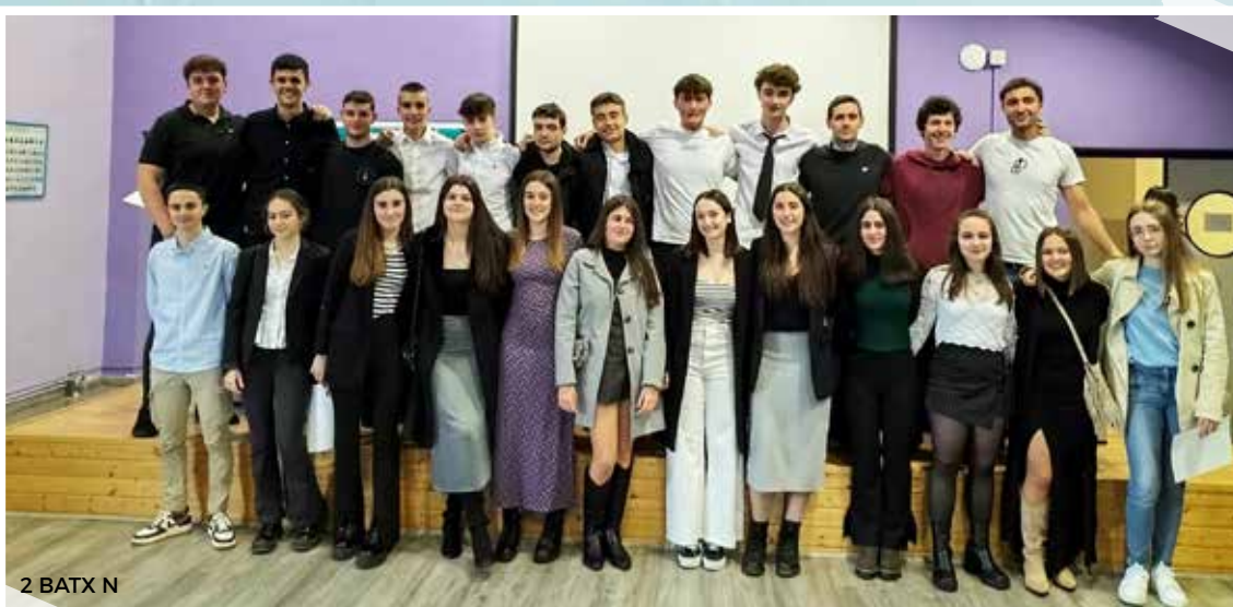
2 BATX N