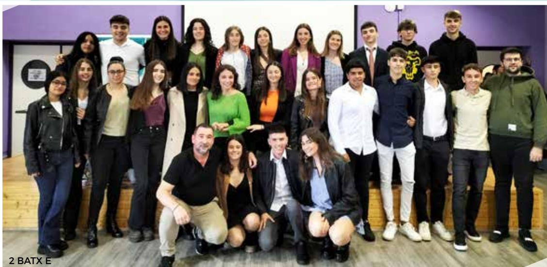
2 BATX E