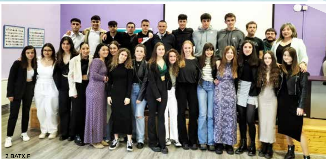
2 BATX F